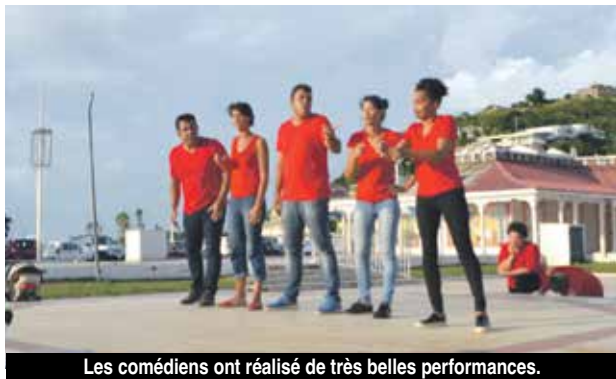
Les comédiens ont réalisé de très belles performances.

Juste les comédiens, tout en simplicité et sans artifice aucun, ont réalisé cette performance de déridier les muscles zygomatiques par leurs excellentes prestations d'improvisations. Près de deux heures d'un pur régal, où les scènes se sont jouées sur des thèmes proposés par le public et se sont succédé dans un rythme effréné. Des thèmes souvent loufoques, parfois absurdes, mais toujours tellement drôles. Et qui