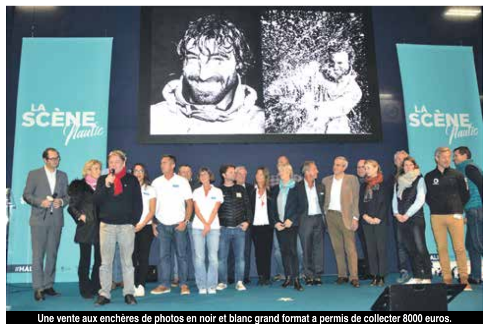
Une vente aux enchères de photos en noir et blanc grand format a permis de collecter 8000 euros.