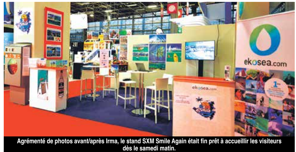
Agrément de photos avant/après Irma, le stand SXM Smile Again était fin prêt à accueillir les visiteurs dès le samedi matin.

Bien arrivée à Paris jeudi dernier, la délégation de Métimer invitée par la Fédération des industries nautiques (FIN) à représenter Saint-Martin au salon Nautique 2017 était fin prête vendredi soir à accueillir les premiers visiteurs samedi, pour l'inauguration du salon.