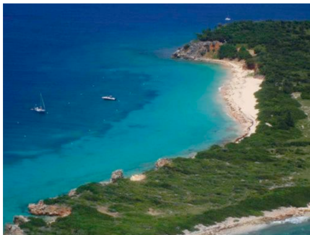
Les bouées de mouillage seront jaunes