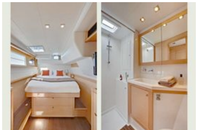
Encore mieux qu'à l'hôtel !

Avant d'attaquer l'ordre du jour, Bulent a fait un compte-rendu de l'opération séduction, pour laquelle trois catamarans et un bateau à moteur ont été mis par Métimer à la disposition des 60 agents de voyage invités par l'Office du tourisme. Le président a regretté que l'Office considère les bateaux comme une simple prestation et n'ait pas conscience qu'ils sont aussi un mode d'hébergement des touristes. Il a souligné que la flotte des sociétés de location représente environ 9000 nuitées par an et a