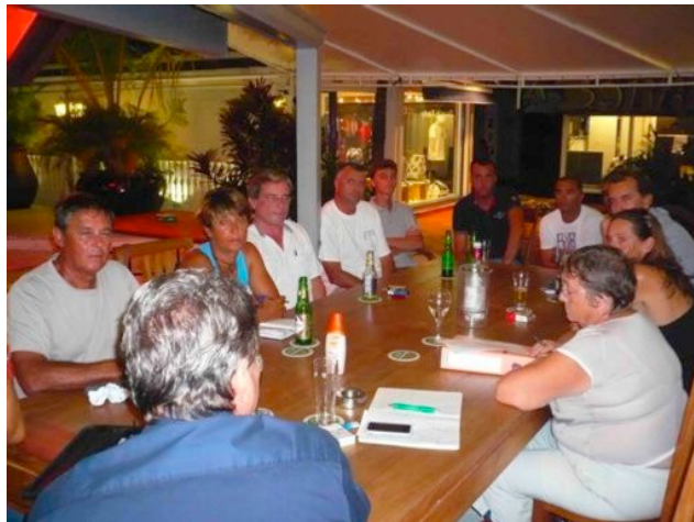
2 réunions mensuelles et 3 AG par an

Parallèlement, la Réserve installe une dizaine de tables de pique-nique en bois à Tintamare, Petites Cayes et Grandes Cayes, ainsi que deux points barbecue à Tintamare.